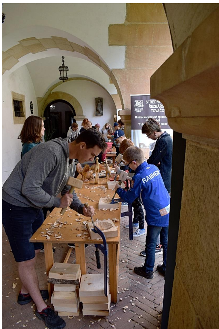
POPISEK: Dny evropského dědictví pro školy 2019

Projekt Místní akční plán rozvoje vzdělávání v SO ORP Šternberk II, zkráceně MAP II, podporuje společné plánování a sdílení aktivit v území. Realizuje naplánované aktivity z místního akčního plánu, jež vedou ke zlepšení kvality vzdělávání v MŠ a ZŠ. Je tak podporována spolupráce zřizovatelů, škol a ostatních aktérů ve vzdělávání. Důraz je kladen na podporu pedagog. pracovníků včetně vedoucích pedagog. pracovníků v rozvoji gramotností a klíčových kompetencí dětí a žáků. Součástí projektu je podpora aktivit vedoucích k podpoře dětí a žáků ohrožených školním neúspěchem. V rámci projektu je realizována celá řada akcí pro školská zařízení. V poslední době jsou v rámci projektu například plánovány exkurze za zaměstnavateli či celá řada akcí pro pedagogy i žáky. V rámci tohoto projektu mají školy možnost zrealizovat také celou řadu vlastních vzdělávacích akcí.