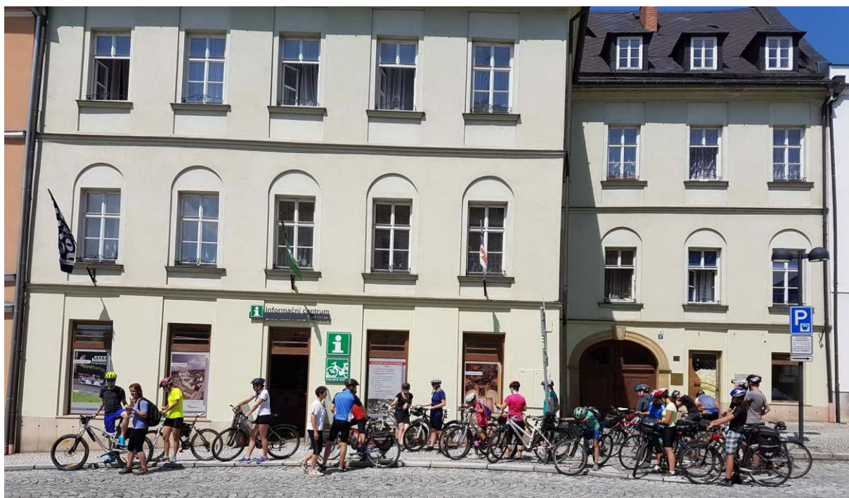
POPISEK: Informační centrum Šternberk

MAS Šternbersko se jako provozovatel Informačního centra Šternberk snaží o realizaci velkého počtu kvalitních kulturních a společenských akcí, ať už v samotném infocentru, nebo i mimo něj. Aktuálně bychom rádi všechny pozvali k účasti na besedě k výročí 30 let od sametové revoluce, která se uskuteční dne 12. 11. 2019 v našem informačním centru. Již teď můžeme slíbit zajímavé hosty a zajímavou diskusi. Informační centrum dále nabízí úschovu kol, veřejný internet, kopírování a laminování, předprodej vstupenek, prodej suvenýrů či nejrůznějších regionálních produktů.