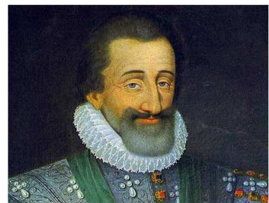
Jindřich IV. Navarský

Romantické poblouznění s rytířskou vášní jej opustilo velmi rychle. Do Francie docestoval se zdravotními i dopravními komplikacemi, nicméně ještě pln optimismu. Jindřich IV. jej osobně očaroval a před prvním vstupem na bojiště nepochyboval v úspěch své strany. Jenomže protějšimu táboru velel zkušený vévoda z Parmy 9 a navzdory počátečním úspěchům se dal očekávat tuhý boj. Moravský rytíř vzápětí přišel o svého přítele - francouzského průvodce, jenž s ním přicestoval až z Moravy a sám jen o vlasek unikl smrti. Potom na něj dolehla deprese podtržena vojenským obratem a rozčarováním z chování Jindřicha IV. a jeho vojsk, kteří: „ Nemálo se o náboženství a slova božího ujímají. “ 10 Roku 1592 se Karel z Francie vrací zklamán a to ještě netušil, že za rok přijde konverze Jindřicha IV. ke katolictví a že ze svých půjčených peněz v této epizodě nic neuvidí. Jediným výsledkem z francouzského tažení tak byla nedůvěra, kterou si Moravan získal u dvora Rudolfa II., ale i cenné zkušenosti.