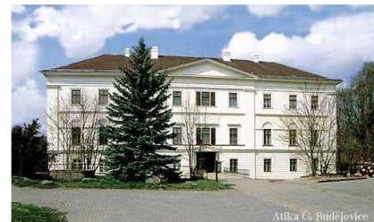
Zámek v Rosicích bylo jedno ze sídel Karla staršího z Žerotína