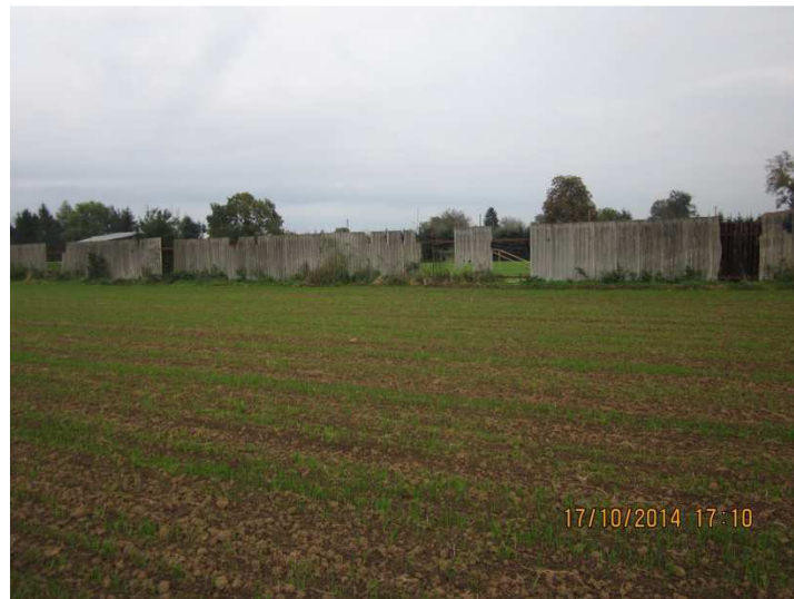
Na horních fotografiích je vandaly zničený plot u hřiště před opravou, dole je plot po opravě. Snad nám dlouho vydrží.