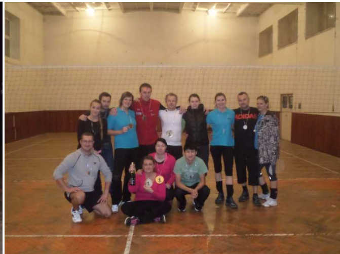
Foto z volejbalového turnaje