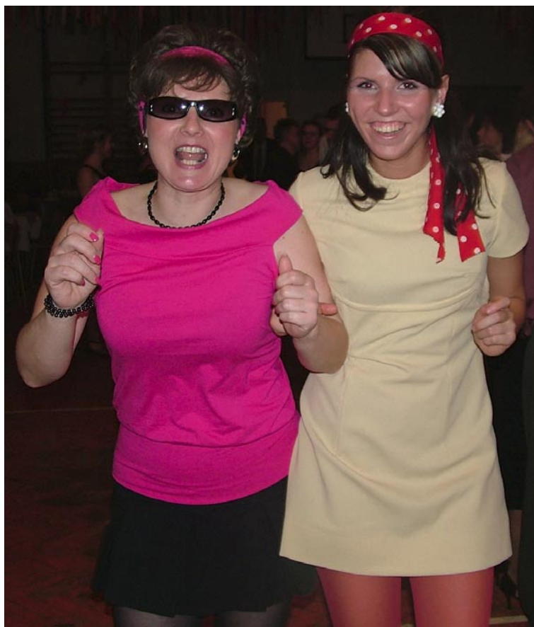
Sokolské šibřinky 2007. Děvčata Novákovice - rebelky z 60.let. Všichni, co jste nepřišli, přijďte určitě příští rok