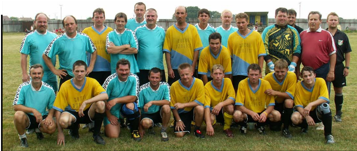
To nejlepší z hnojického fotbalu - mezigenerační fotbalový výkvět. Foceno v červenci 2006 při příležitosti výročí 40ti. let hnojického fotbalu.

Před uzávěrkou došla dobrá zpráva. V Jířkově jsme vyhráli 2:1!