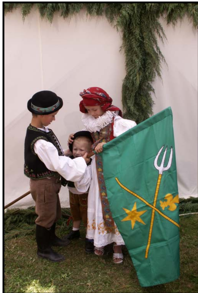
Malý, ale pěkný zlomek reprezentace hnojických občanů na Dnech dobré vůle na Velehradě - 6. 7. 2006.