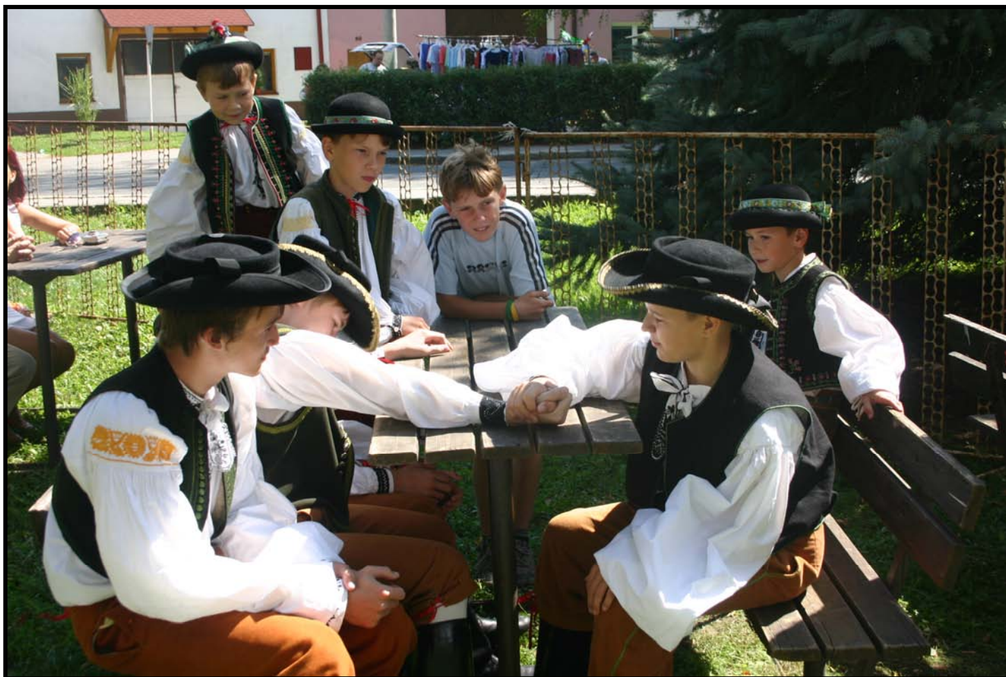
Hody 2006. Mladí muži ze souboru Pomněnke. " Kluci, bez vás to vážně nebude ono, moc prosíme, tancejte dále..."