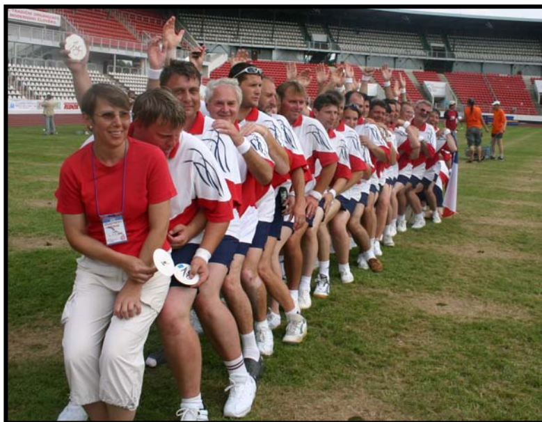
Hnojáčáci na Strahově 5. - 6. 7. 2006 („vážení, jsme na vás hrdí“)

Plánuje se renovace dveří, pokračování prací na odvlhčení zdiva.. Bylo by velmi potřebné zavést do kostela vodu a kanalizaci, vybudovat sociální zařízení. Po opravě volá také střecha, krovy a věž, v lodi kostela se propadá podlaha. Sochy a dřevěné oltáře obtěžují červotoči, starší lidé by uvítali topení,